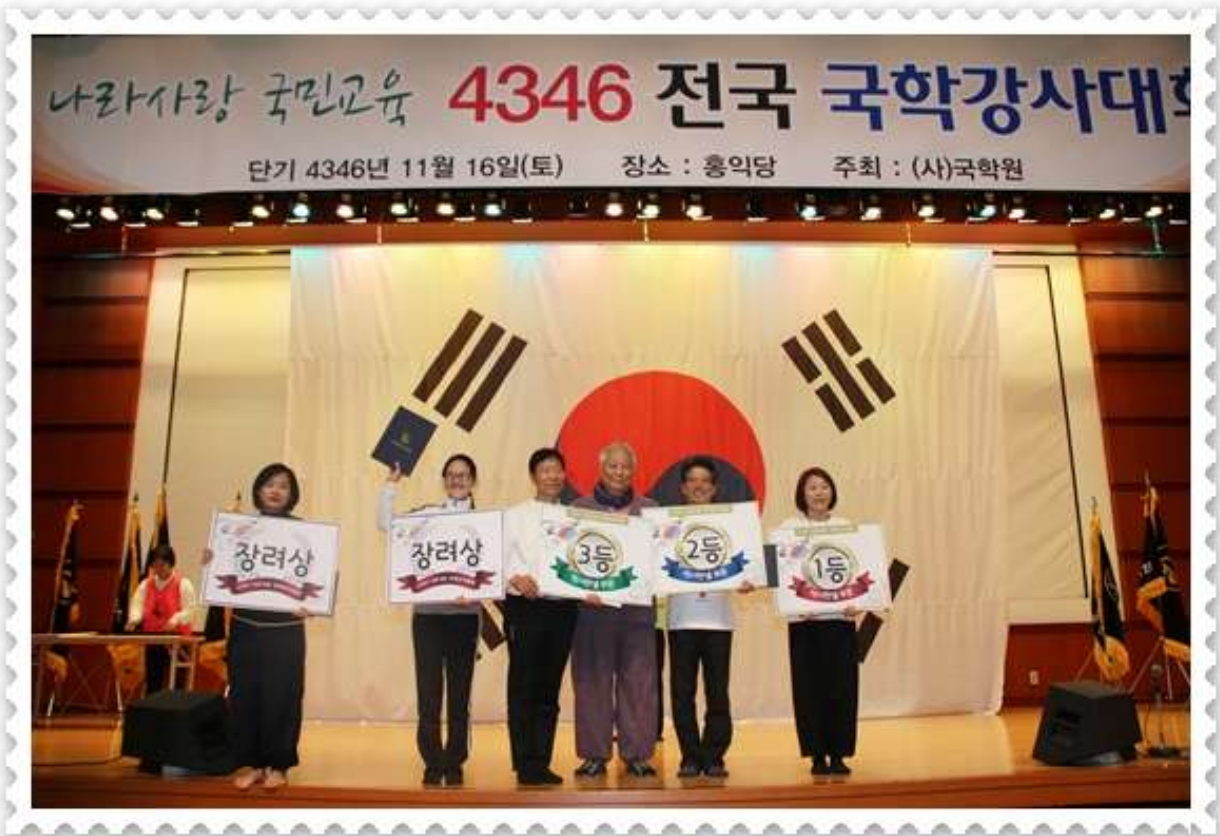
역사판넬전시 부문- 1등 경기국학원, 2등 대구국학원, 3등 서울국학원, 장려상 대전, 울산국학원