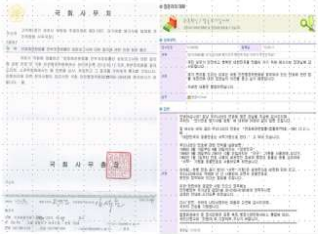
단기연호 병기사용 법제화 청원서에 대한 국회사무총장 답신