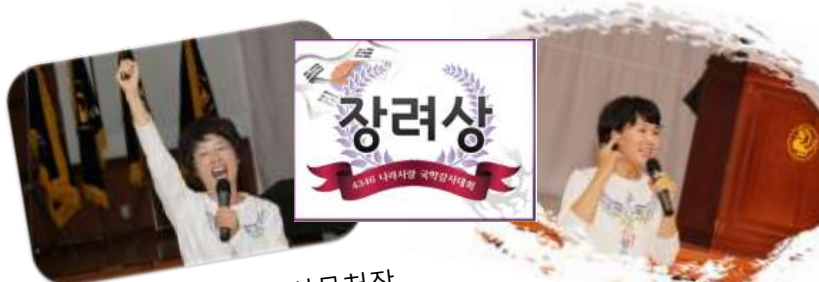
경북국학원 박주아 사무처장