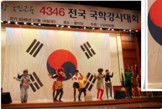
대전국학원 씨니 댄스