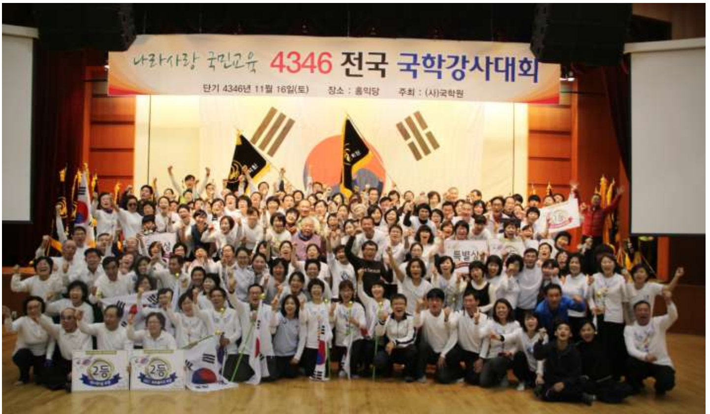
전국의 16개 시도지부의 국학원 강사들이 모여 '나라사랑 국민교육 4346 전국 국학강사 경연 대회' 를 개최했다.