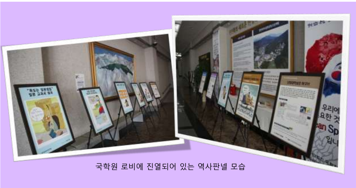
국학원 로비에 진열되어 있는 역사판넬 모습