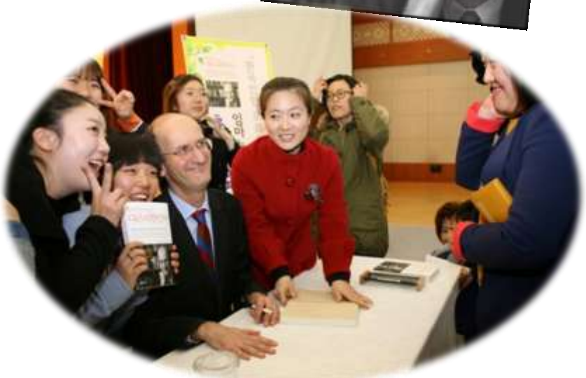
독자들과 함께 한 출판사인회