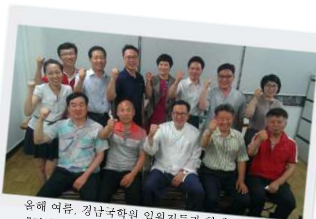
올해 여름, 경남국학원 임원진들과 함께 “경남국학원 파이팅!!!”

2014년에는 모든 지역 국학원에서 민족혼의 불길이 더욱 크게 일어날 것을 상상하니 벌써 기쁘고, 절로 신이나는 것 같다.