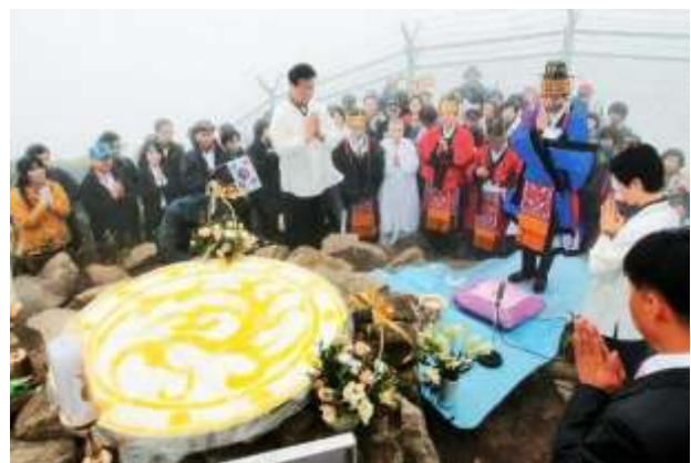
대구 팔공산에서 천제를 지내는 모습

2003년부터 대구 팔공산 천제단 문화복원사업, 1998년부터 개천행사를 진행한 대구국학원은 음력개천절을 기념하기 위해 세미나를 마련했으며, 대구광역시 보조금 사업으로 선정되어 지원을 받았다.