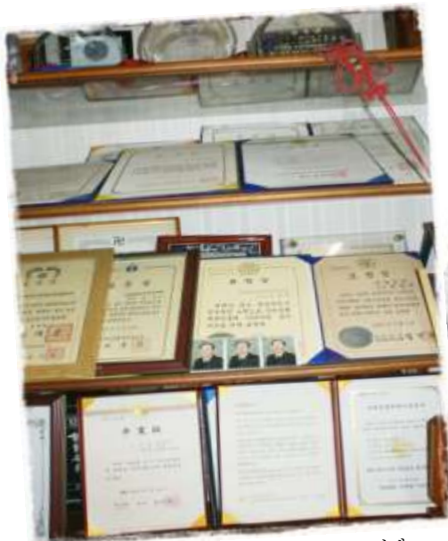
각종 단체에서 수상한 수많은 상장과 감사패

로도 평생 힘닿는 날까지 국학기공으로 되찾은 몸과 마음의 건강에서 깨어난 첫 마음을 지킬 것이라고 약속한다. 우리 민족의 신명이 살아나 모든 이들이 밝고 환해지는 스마일 홍익 세상을 꿈꾸며~~