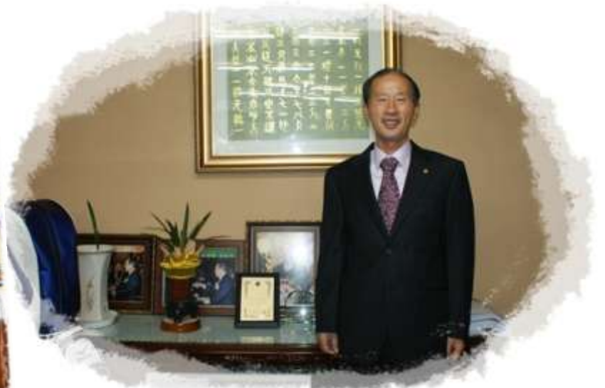
언제나 어디서나 밝은 얼굴과 환한 미소로 홍익을 실천하고 있다