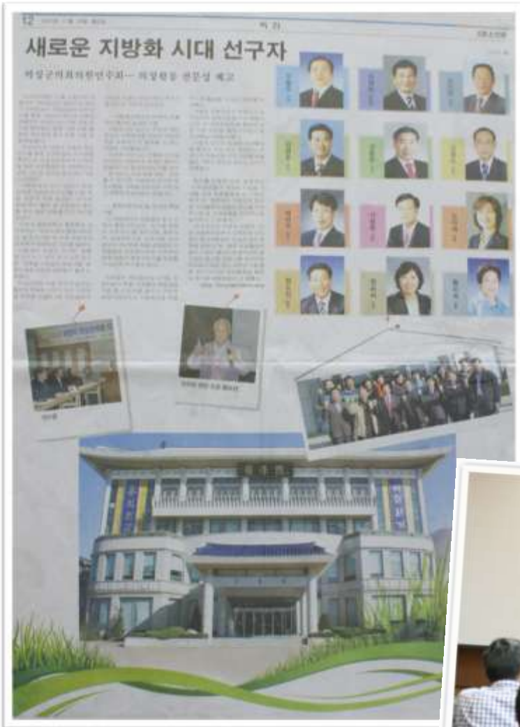
‘의성문소신문’에 게재된 1박 2일 의성군의회 연수 소식