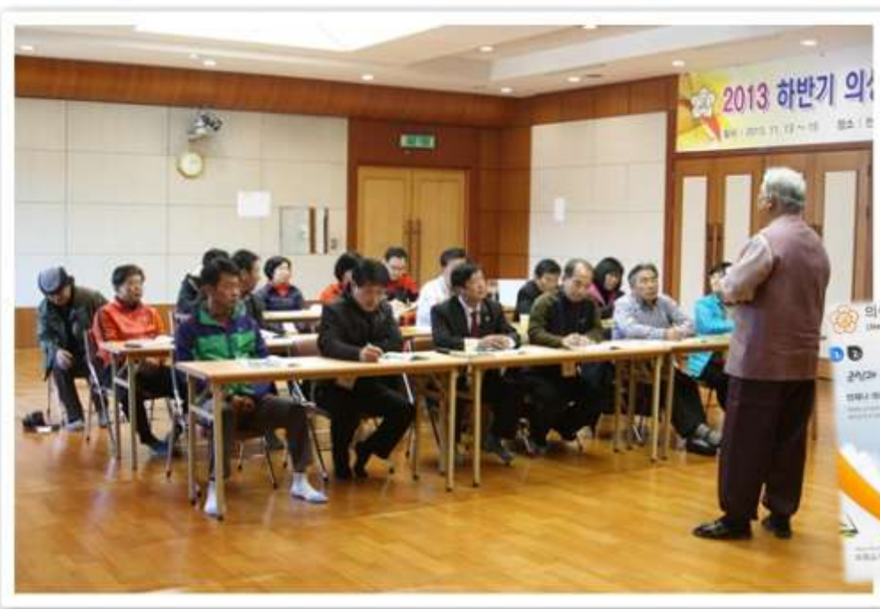
의성군의회 의원들이 국학원 교육장에서 연수를 받고 있는 모습