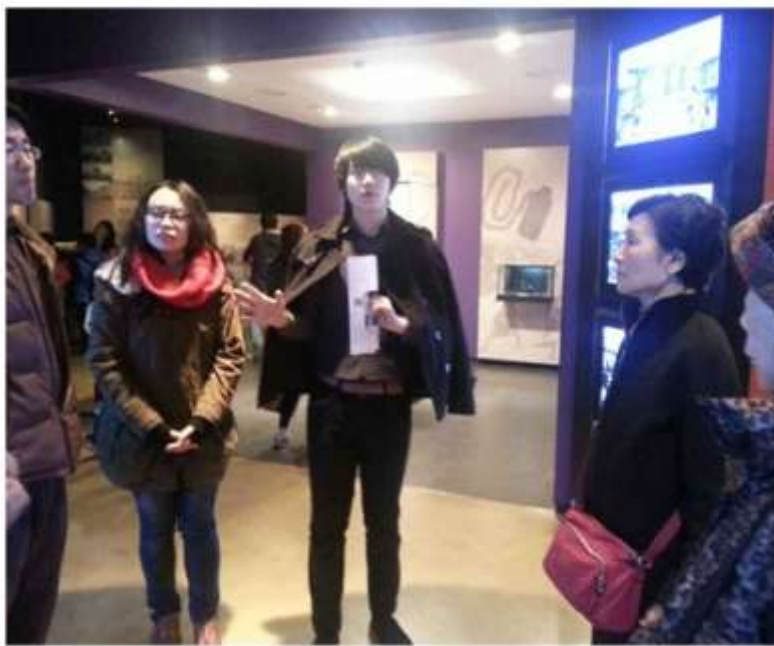
서대문 형무소 역사박물관 투어