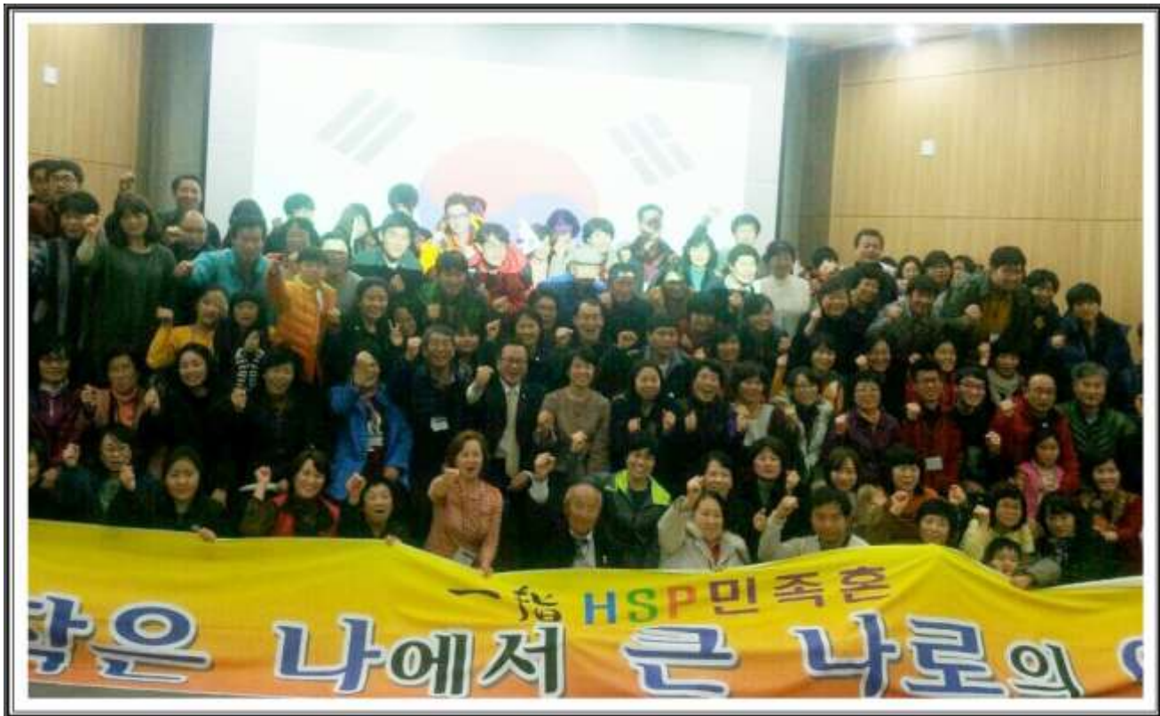
작은 나에서 큰 나로의 여행—민족혼 교육